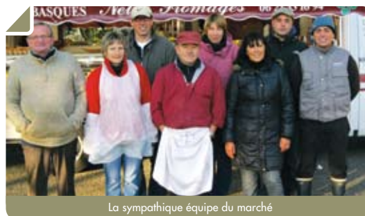
La sympathique équipe du marché

À la demande de la municipalité, la CUB vient d'achever les travaux de réfection des trottoirs en enrobés rouges des lotissements de Berliquet et de Greenfield.