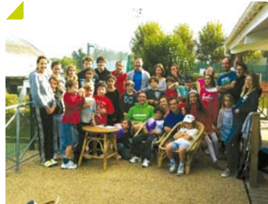
La sympathique équipe du Tennis club de Bouliac