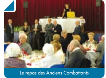
Le repas des Anciens Combattants