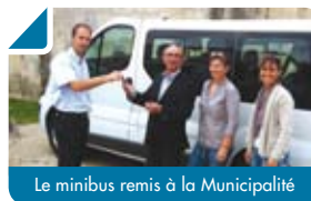
Le minibus remis à la Municipalité

La Mairie de Bouliac a fait dernièrement l'acquisition d'un minibus d'une capacité de 9 places dans le but de fournir aux habitants un service de proximité.