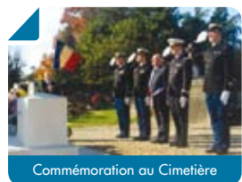
Commémoration au Cimetière