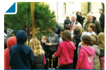
Green Day ou la Journée Verte

À 10 h 30, un premier dépôt de gerbe fut effectué au Monument aux Morts, place Chevelaure. La cérémonie s'est poursuivie au cimetière communal ainsi qu'au Monument aux Morts « Les 4 murs », route de Latresne. L'hommage fut suivi d'un vin d'honneur offert par la Municipalité au centre culturel François Mauriac. Enfin, à 13 h, un repas présidé par M. le Maire fut servi en l'honneur des Anciens Combattants, à la salle des fêtes communale.