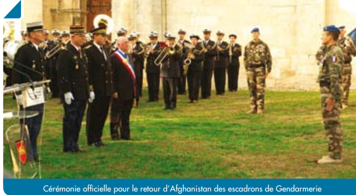
Cérémonie officielle pour le retour d'Afghanistan des escadrons de Gendarmerie

La commune de Bouliac a souhaité mettre à l'honneur le retour tant attendu des escadrons de Gendarmerie 12/2 de Bouliac et 13/2 de Marmande, partis durant plusieurs mois en Afghanistan.