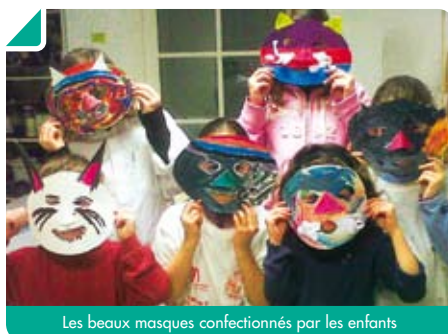
Les beaux masques confectionnés par les enfants

Contact et renseignements au 06.24.98 11.43 ou au 06.21.66.57.20.