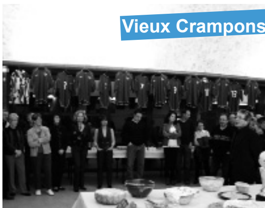
Les Vieux Crampons réunis à la salle des fêtes