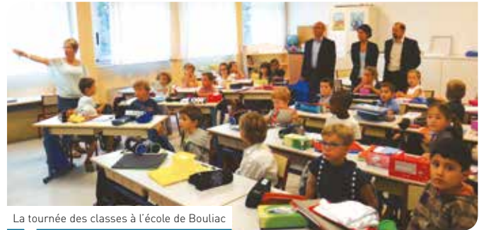
La tournée des classes à l'école de Bouliac