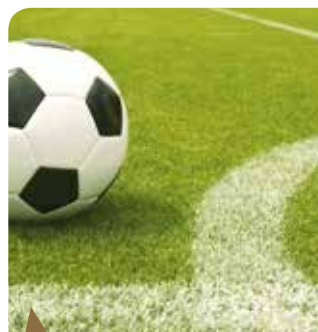
Terrain de football

Une troisième classe de primaire a été équipée d'un tableau numérique qui vient compléter les 2 installés l'année dernière.