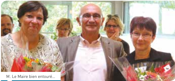
M. Le Maire bien entouré...