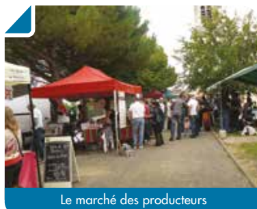
Le marché des producteurs

Outre la journée américaine et les 20 ans du jumelage, le 14 septembre proposait également un rendez-vous avec le Marché des Producteurs qui a permis de rassembler les gourmets sur l'esplanade de l'Église pour une pause gastronomique toujours appréciée.