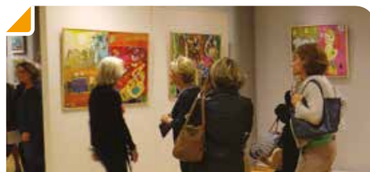
Les œuvres de l'artiste et ses amateurs

Installé en France au milieu des années 90, il put enfin laisser libre cours à sa passion et à son imagination débordante et singulière pour créer une peinture marquée, vibrante, aux traits forts et appuyés. Des tableaux gorgés de couleurs ardentes dont le fort impact visuel et émotionnel ne laisse pas indifférent !