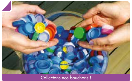
Collectons nos bouchons !

Participez à cette chaîne de solidarité au profit des handicapés et personnes à mobilité réduite. Pour déposer vos bouchons, adressez vos courriels à Esther SAN SEGUNDO : esther-bouliac@voila.fr qui vous proposera un rendez-vous au parc de Vialle. Pour les enfants scolarisés, un collecteur est également disponible à l'école primaire.