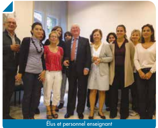
Élus et personnel enseignant

À l'occasion de leur venue, les amis Hélvètes ont eu l'occasion d'apprécier des spécialités typiques de la région. Leur périple a débuté par la visite de la jolie commune de St-Émilion avec une visite de chais et une dégustation à la clé. Une visite de Bordeaux était également prévue et bien entendu une cérémonie digne de l'amitié entre les deux communes, en présence de M. le Maire et l'ensemble de son Conseil. Une cérémonie pleine d'émotion et de surprises, où M. le Maire n'a pas caché son plaisir de décerner à son homologue Suisse les clés de Bouliac et des petits présents pour les accompagnants. Chacun a pu sceller encore un peu plus cette amitié franco-suisse autour d'un cocktail offert par la Municipalité en se promettant de se revoir bien vite... La semaine d'après précisément, où c'était au tour des élus de Bouliac de se rendre chez leurs homologues Suisses.