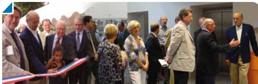
Une inauguration en grande pompe