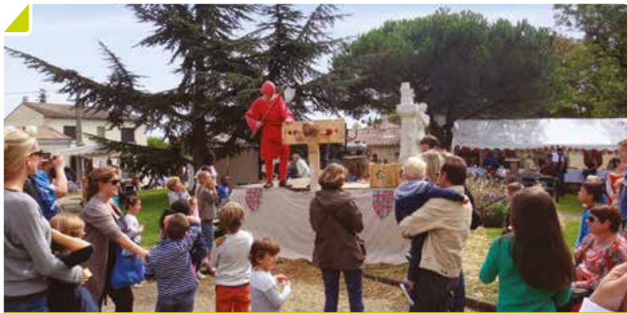
La terreur règne à Bouliac !

C'est incontestablement un événement majeur dans la Commune. Cette édition n'a pas échappé à la règle. Tournois, costumes, chevaliers, bâtisseurs, typographes chacun a pu faire montre de son talent. Et l'animation phare cette année était vraisemblablement l'exécution publique ! Hé oui, un (gentil) bourreau se chargeait de décapiter les enfants qui n'avaient pas été sages, devant une assistance complice et amusée.