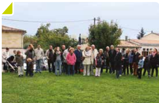
Les nouveaux Bouliacais