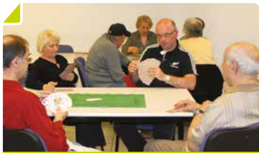
Des joueurs de tarot assidus

Rendez-vous l'année prochaine pour la 20 e édition de cette journée pour ceux qui n'ont pu participer et nos prochains arrivants.