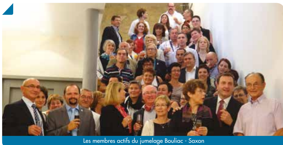
Les membres actifs du jumelage Bouliac - Saxon