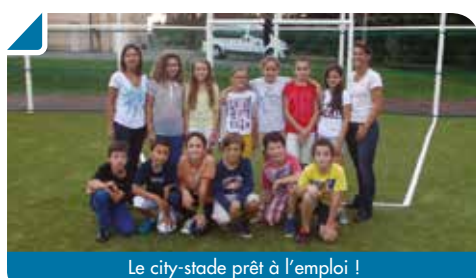
Le city-stade prêt à l'emploi !