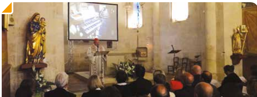
La bénédiction des orgues de l'église de Bouliac