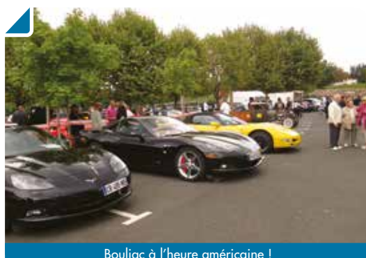
Bouliac à l'heure américaine !