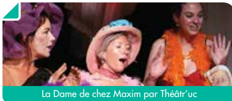
La Dame de chez Maxim par Théâtre'uc

La troupe de Bouliac a eu la chance de participer cette année à cette manifestation qui existe depuis 5 ans et a reçu un accueil enthousiaste de la part d'un public nombreux, le 13 novembre dernier pour une nouvelle représentation de « La Dame de chez Maxim ». Par ailleurs, les répétitions d'un nouveau spectacle se poursuivent et vous pourrez venir applaudir notre nouvelle pièce : « Le tour du monde en 80 jours » les 3, 4 et 5 avril, à la salle panoramique du Centre Culturel.