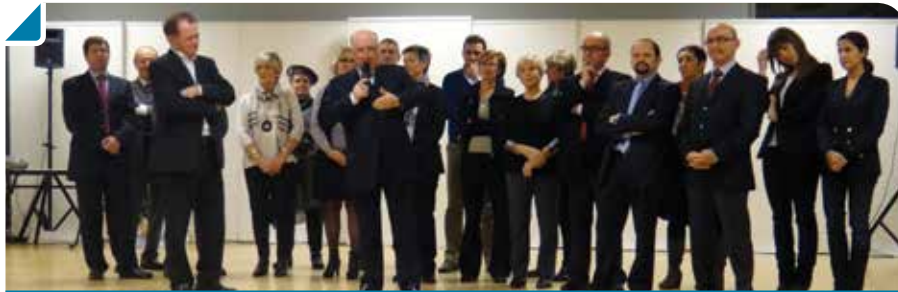
Le Conseil municipal entourant M. Le Maire pour son allocution des vœux