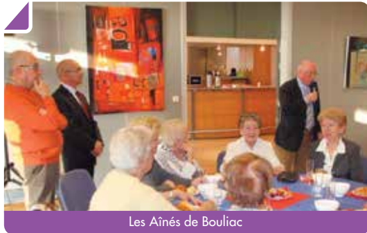
Les Aînés de Bouliac