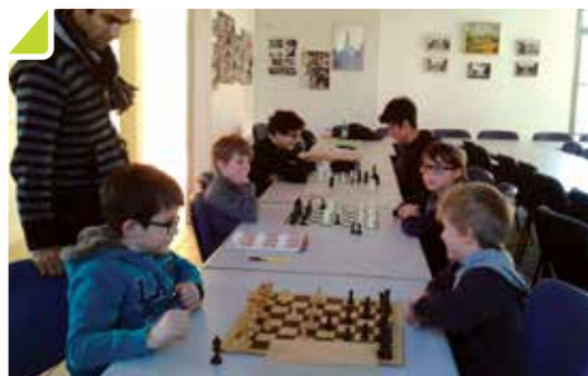
La nouvelle section de jeu d'échecs de Bouliac