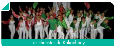
Les choristes de Kakophony