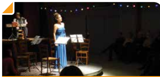
L'une des cantatrices du spectacle

Ne manquez pas le prochain rendez-vous culturel : l'exposition « L'image dans les nuées » les 8, 9 et 10 février. Vernissage le vendredi 7 février à 19 h 30, salle panoramique du Centre Culturel François MAURIAC.