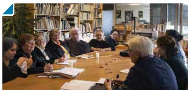
Le groupe de recherche Science et Patrimoine au centre Léo DROUYN

Ce qu'il faut dire surtout, c'est que les activités du centre Léo DROUYN se déroulent dans une ambiance de bonne humeur et même d'amitié. C'est bien ainsi que les étudiants considèrent leur fréquentation du centre, et il en va de même de la partie du public composée de personnes plus âgées encore en activité ou à la retraite.