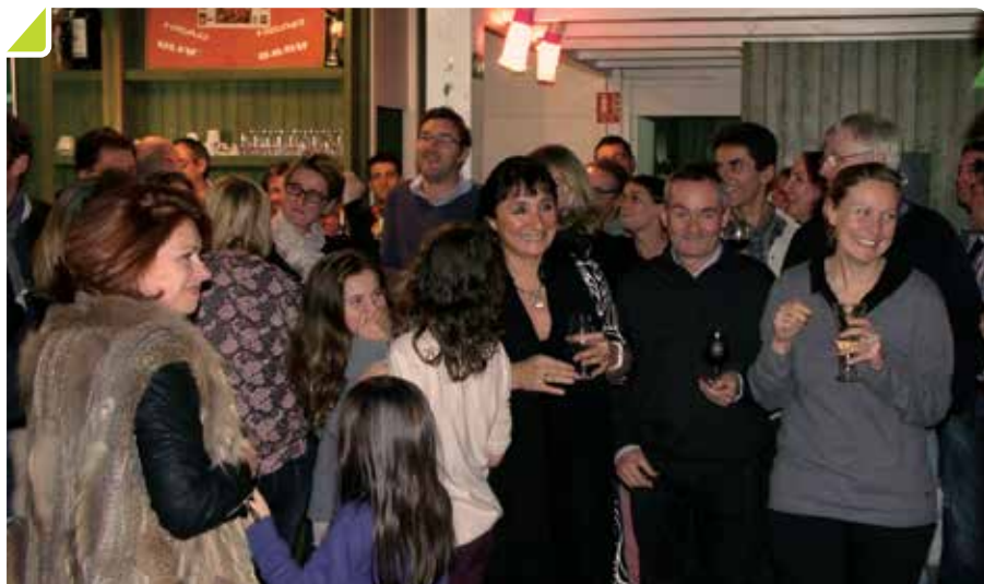
Les joyeux membres et amis du TC Bouliacais