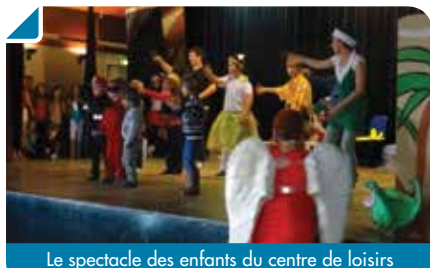
Le spectacle des enfants du centre de loisirs

Il y avait de l'ambiance à la salle des fêtes le 20 décembre dernier !