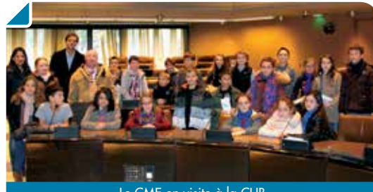
Le CME en visite à la CUB

un drôle d'ange conteur, le tout dans une ambiance survoltée... pour le plus grand plaisir des parents venus nombreux et des enfants qui avaient mis du coeur, de la volonté et de l'énergie dans ce spectacle !