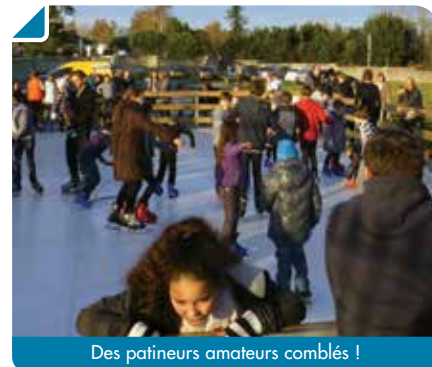
Des patineurs amateurs comblés !

C'est un euphémisme de dire que l'animation a comblé de nombreux Bouliacais ! Il fallait voir petits et grands chausser avec frénésie leurs patins et s'élaner sur la piste avec un plaisir non dissimulé. Entre rires, chutes, petits bobos et (essais de) chorégraphies, une foule joyeuse de patineurs prenait place chaque jour sur la piste, encouragés et soutenus par les parents et amis, massés autour de la patinoire. Les rois de la glisse s'en sont donné à cœur joie !