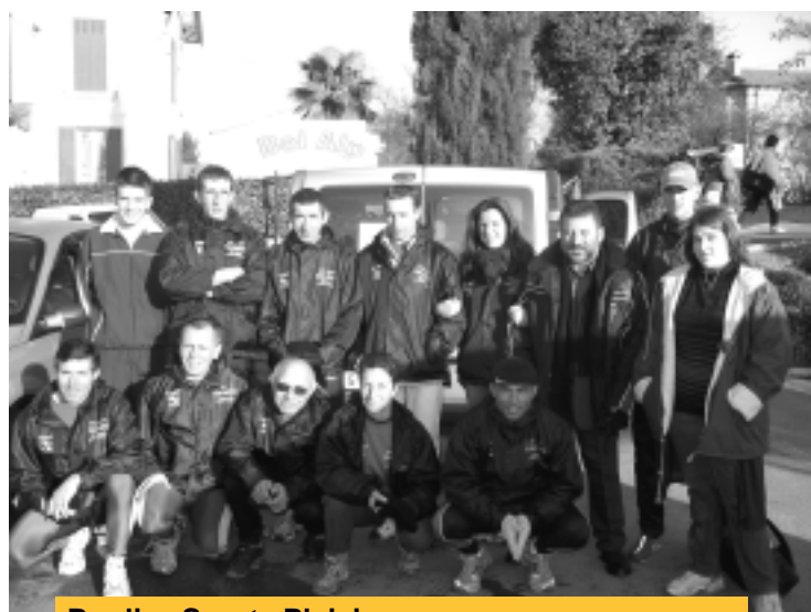
Bouliac Sports Plaisirs, élu meilleur club de course girondin de l'année.