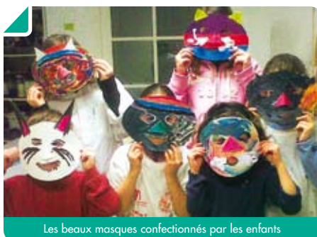
Les beaux masques confectionnés par les enfants

Contact et renseignements au 06.24.98 11.43 ou au 06.21.66.57.20.