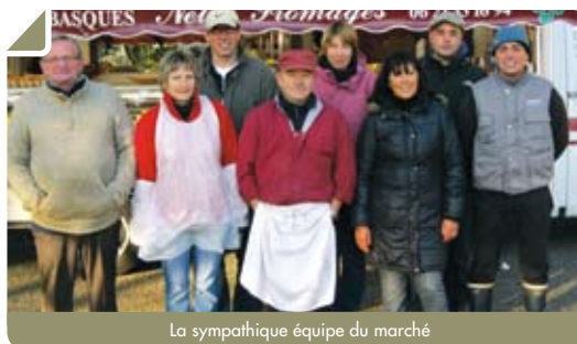
La sympathique équipe du marché

À la demande de la municipalité, la CUB vient d'achever les travaux de réfection des trottoirs en enrobés rouges des lotissements de Berliquet et de Greenfield.