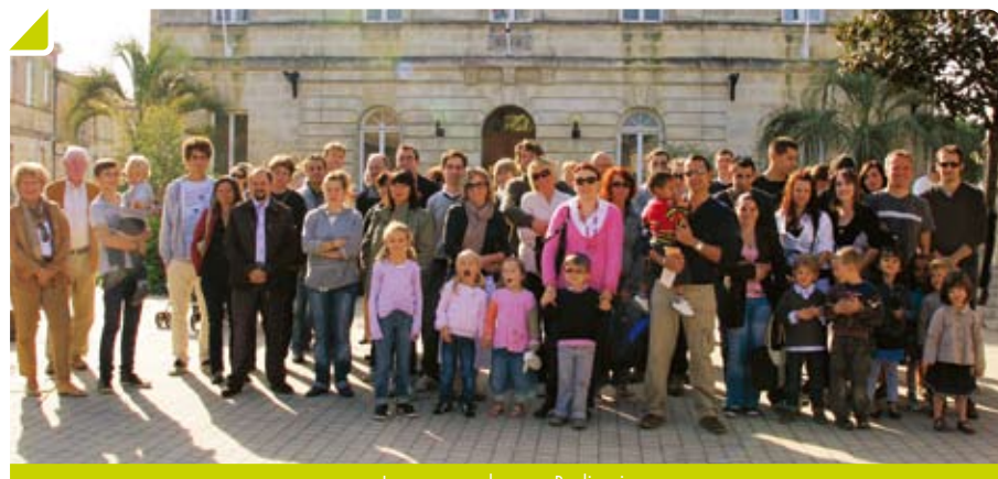
Les nouveaux heureux Bouliacais