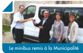
Le minibus remis à la Municipalité

La Mairie de Bouliac a fait dernièrement l'acquisition d'un minibus d'une capacité de 9 places dans le but de fournir aux habitants un service de proximité.