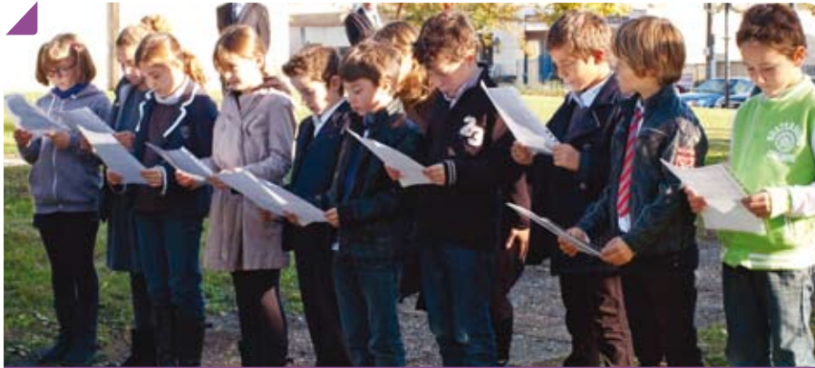
Lecture d'un discours par les membres du Conseil Municipal des Jeunes lors du 11 novembre dernier