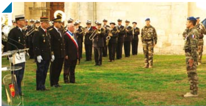
Cérémonie officielle pour le retour d'Afghanistan des escadrons de Gendarmerie

La commune de Bouliac a souhaité mettre à l'honneur le retour tant attendu des escadrons de Gendarmerie 12/2 de Bouliac et 13/2 de Marmande, partis durant plusieurs mois en Afghanistan.