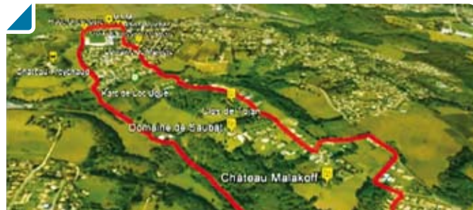
Visualisation 3D d'un circuit de balade

Bouliac sert de poumon vert à ses habitants mais également à toute l'agglomération. Havre de verdure à la lisière du bourg, le parc de Loc Boué a été créé en 1995 par la municipalité. Sur près de 6 hectares, il abrite des dizaines d'essences d'arbres (chênes verts, pins parasols, cèdres de l'Atlas...) qui concourent à donner à la colline et à la commune un air résolument méditerranéen !