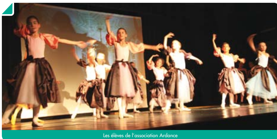
Les élèves de l'association Ardance