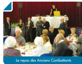
Le repas des Anciens Combattants

À 10 h 30, un premier dépôt de gerbe fut effectué au Monument aux Morts, place Chevelaure. La cérémonie s'est poursuivie au cimetière communal ainsi qu'au Monument aux Morts « Les 4 murs », route de Latresne. L'hommage fut suivi d'un vin d'honneur offert par la Municipalité au centre culturel François Mauriac. Enfin, à 13 h, un repas présidé par M. le Maire fut servi en l'honneur des Anciens Combattants, à la salle des fêtes communale.