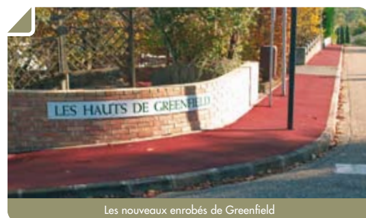
Les nouveaux enrobés de Greenfield

Pour faciliter le retour des livres par les adhérents, la bibliothèque municipale de Bouliac vient de se doter « d'une boîte aux livres ». Visible de l'allée centrale du parc, elle se situe sur le mur, à droite avant d'arriver à l'entrée principale de la bibliothèque. Les adhérents pourront ainsi rapporter leurs livres selon leur convenance personnelle.