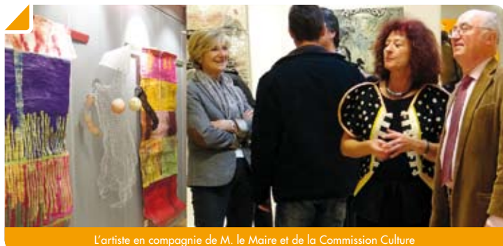
L'artiste en compagnie de M. le Maire et de la Commission Culture