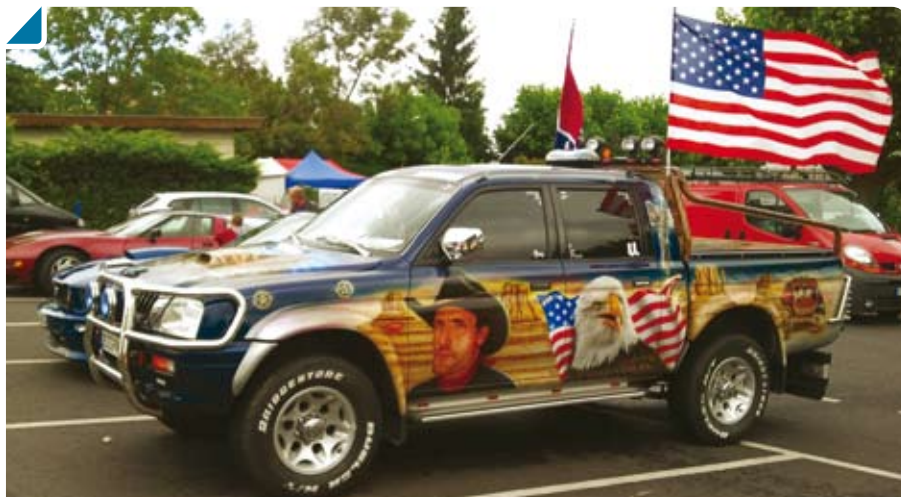
Quel beau pick-up !