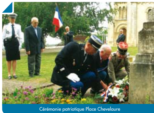
Cérémonie patriotique Place Chevalaure