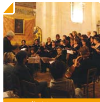
Un très beau concert

Le 8 juin dernier, l'Église St-Siméon-le-Stylite accueillait en son chœur la chorale Altaïr et l'ensemble Zimmerman pour une très belle représentation lyrique sous le patronage de la Commission Culture.