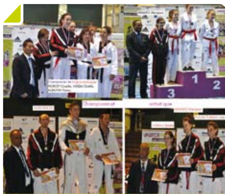
L'équipe du Taekwondo aux Championnats de France