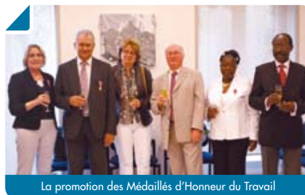
La promotion des Médailles d'Honneur du Travail

Bouliacaises et Bouliacais, nous vous attendons nombreux pour fêter ce 14 juillet !