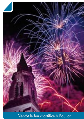
Bientôt le feu d'artifice à Bouliac

À partir de 20 h 00, ouverture des festivités avec un repas dressé Place de l'Église dans une ambiance animée. Vous pourrez festoyer et vous régaler autour d'un banquet aux couleurs espagnoles... Au menu : Paëlla !