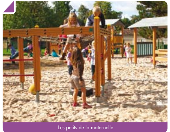
Les petits de la maternelle