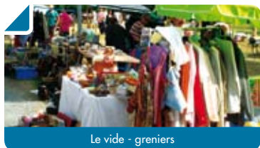
Le vide - greniers

Les traditionnelles belles américaines étaient présentes et avaient sorti leur plus beaux atours pour séduire et ravir l'œil de l'amateur ! Sensations garanties avec certains phénomènes qui ont fait briller les mirettes... Mention spéciale également aux « Gutter Boys », un rock band au son et à l'élégance très 60's qui a contribué à animer ce dimanche un peu maussade. Pour l'année prochaine, on commande du soleil pour faire briller encore un peu plus les chromes et les carrosseries ! Bye bye and see you next year !