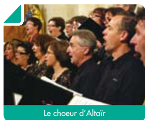
Le chœur d'Altaïr