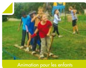
Animation pour les enfants