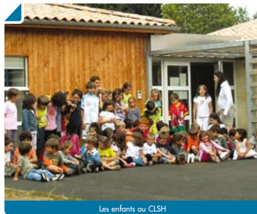
Les enfants au CLSH

Les emplacements, divers et variés, regorgeaient de trouvailles, vêtements, objets anciens pour collectionneur, amateur, bricoleur ou simple visiteur. Le Parc de Vialle se transformait en une énorme halle d'échanges, de troc, de vente. L'événement est toujours l'occasion de trouver son bonheur ou de faire le bonheur de quelqu'un. Tradition respectée !