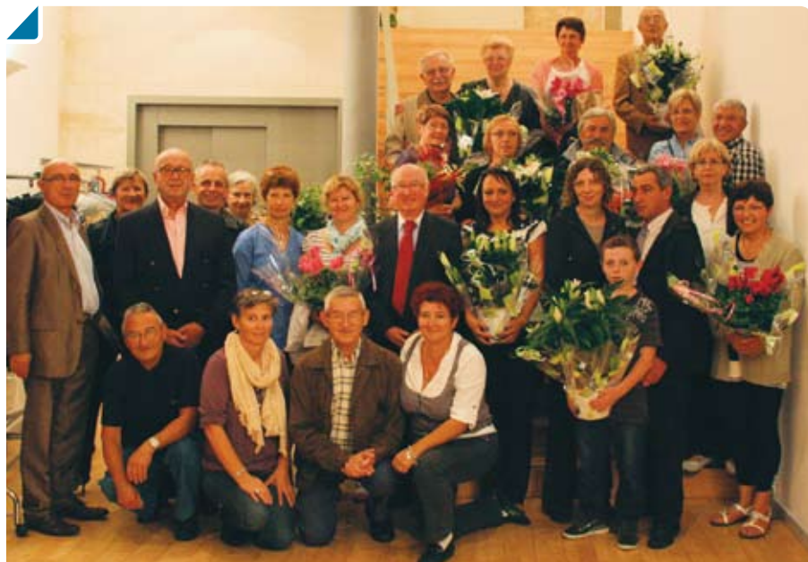
Des hommes et des femmes qui ont la main verte !