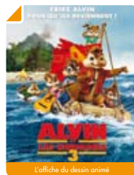
L'affiche du dessin animé