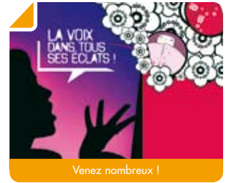
Venez nombreux !

La compagnie France en Scènes vous propose un fabuleux voyage dans la voix humaine. Un spectacle qui saura vous emporter dans le tourbillon des émotions suscitées par la voix de l'homme ! Voix graves ou aigües, voix d'enfants, opéra, chansons traditionnelles, gospel, bruitage, sifflet ou rires... Laissez-vous transporter ! Un événement à ne pas manquer le 7 décembre prochain, salle des fêtes de Bouliac à 20h30. Entrée libre mais places limitées, pensez à réserver !