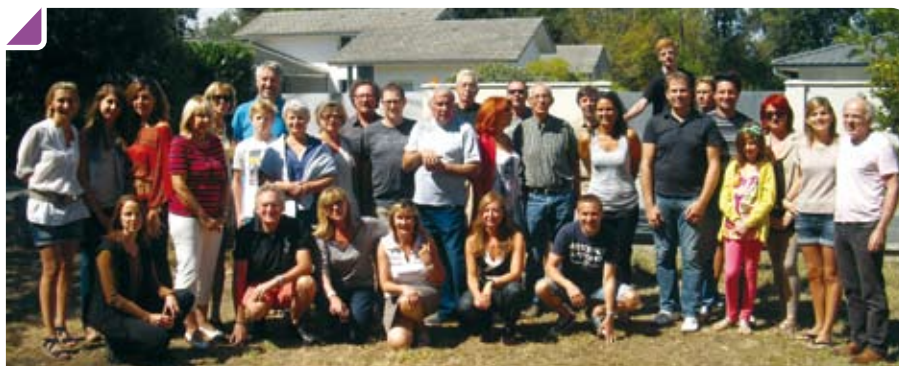
Les sympathiques habitants du Chemin de Brousse

Et n'oubliez pas, tous les mardis après-midi « scrabble » et deux jeudis par mois « bingo ». Venez nous rejoindre pour toutes ces manifestations et sorties conviviales !