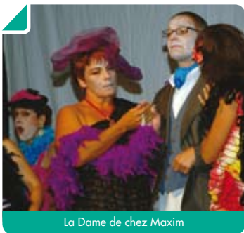
La Dame de chez Maxim