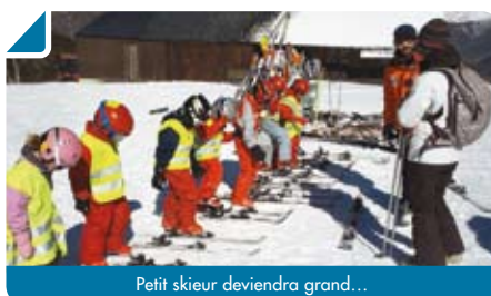
Petit skieur deviendra grand...

Sur le thème : « Oser vaincre » et avec Franck DUBOSC comme parain, Bouliac Sport Plaisirs organise une course à pied et une marche le samedi 1 er décembre à 14 h . Le vendredi 7 décembre à 20 h 30 à la salle des fêtes, aura lieu une vente de produits au profit du Téléthon. Le samedi 8 décembre après-midi au même endroit, un spectacle sera donné par les enfants du Centre de Loisirs avec le concours des associations qui participeront toute la journée à la collecte de dons. Venez nombreux !