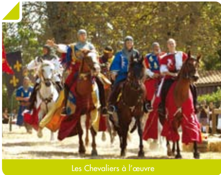
Les Chevaliers à l'œuvre