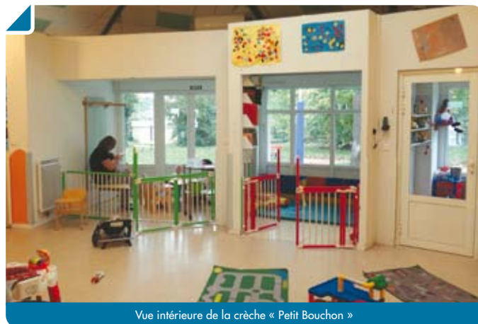
Vue intérieure de la crèche « Petit Bouchon »

RAM, crèche, ludothèque (...) la Municipalité s'est donné les moyens de ses ambitions pour la Petite Enfance !