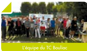
L'équipe du TC Bouliac