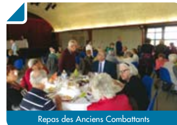
Repas des Anciens Combattants

Il avait eu lieu le 11 novembre dernier en salle des fêtes.