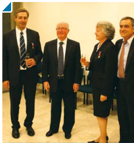
M. le Maire entouré des récipiendaires

Toutes nos félicitations à ces travailleurs méritants.