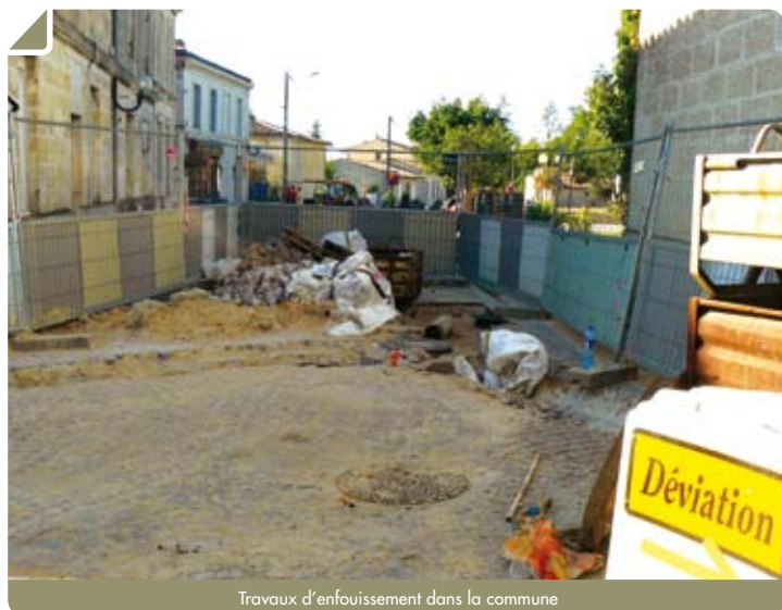
Travaux d'enfouissement dans la commune