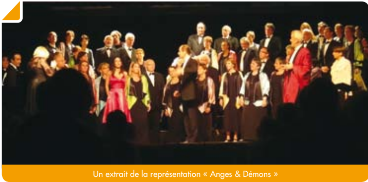
Un extrait de la représentation « Anges & Démon »