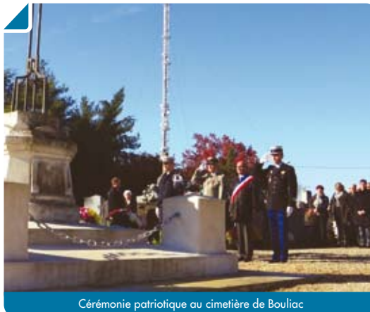
Cérémonie patriotique au cimetière de Bouliac