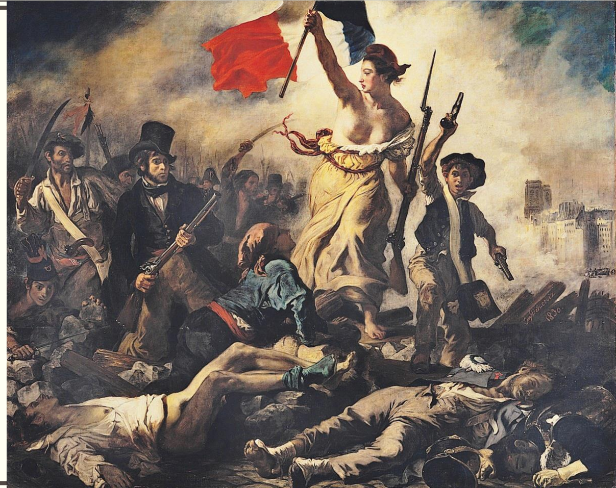
Eugene Delacroix : La Liberté guidant le peuple